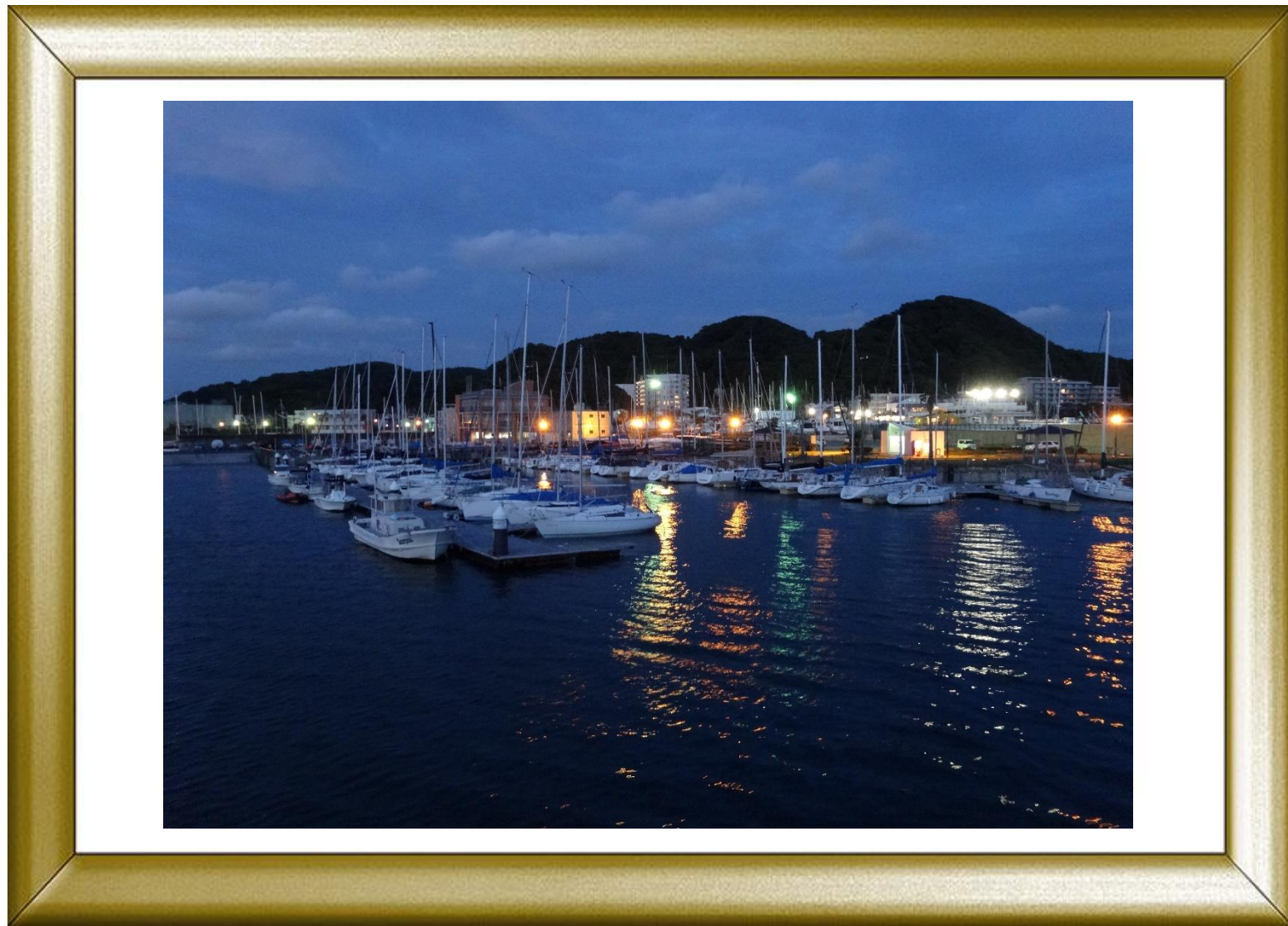
「葉山港夕景」 チェリー 森谷 礼裕